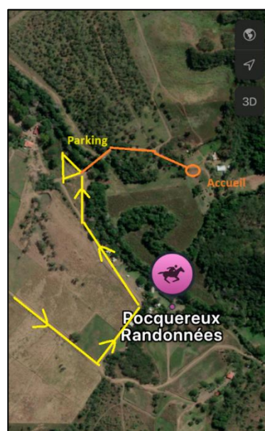
Dimanche 6 Avril 2025